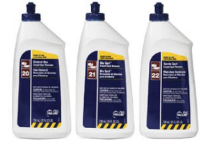
Détachants à tapis P&G Pro Line à l'usage général, Bio Spot et pour taches de tanin

FRÉQUENCE DE NETTOYAGE: Lorsqu'il y a des éclaboussures ou de la saleté, il est important d'éliminer les taches, les éclaboussures, la gomme ou les résidus collants dès que possible afin d'empêcher que la tache ne s'incruste.